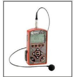
SN151 SN152 SN153 SN154