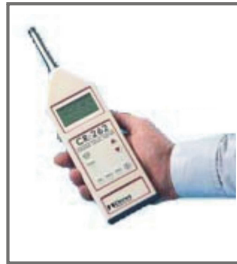
SN028 SN028A SN028B SN028C